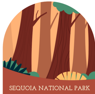
SEQUOIA NATIONAL PARK

Las actividades recreativas y deportivas adaptadas ofrecen actividades y asistencia especial a personas de 13 años o más con discapacidad intelectual. El programa PALS es un club social para personas mayores de 13 años. El programa de recreación y deportes adaptados ofrece deportes integrados durante todo el año para mayores de 13 años.