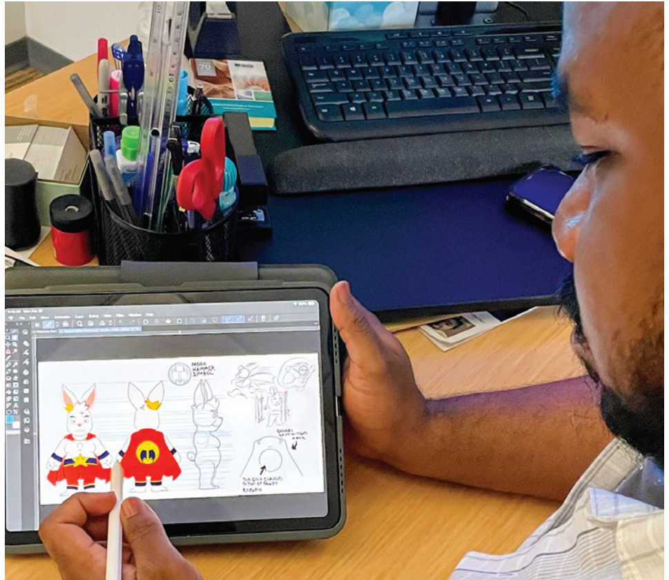
Primer plano del desarrollo de personajes de Tim'an

A diferencia de OurTism, que ofrece un enfoque más generalizado al apoyo social para personas con discapacidades, Game Gen es un programa vocacional y asociado del centro regional, que se especializa en enseñar a adolescentes y adultos con discapacidades los fundamentos del diseño de videojuegos. Game Gen ofrece una variedad de clases y seminarios destinados a desarrollar las habilidades en ciencias de la computación; incluyendo, entre otras, codificación, diseño de personajes, creación de activos, edición de video, programación y marketing. Como artista y jugador de toda la vida, esta fue una oportunidad para desarrollar mi conjunto de habilidades y establecer contactos con personas que persiguen una carrera en la industria del juego. Aunque todavía estoy en las primeras etapas de mi camino de aprendizaje y equilibrando mi educación con un trabajo