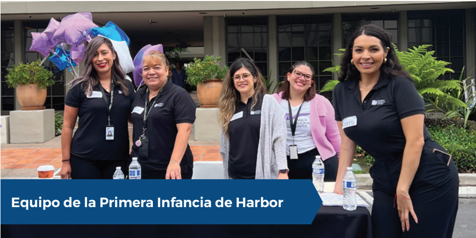
Equipo de la Primera Infancia de Harbor

La coordinación de servicios es un componente fundamental de los centros regionales. Cada persona atendida está emparejada con un coordinador de servicios (SC, según la sigla en inglés), a quien la Ley Lanterman define como alguien que ayuda a prepararse para su reunión de planificación individual, a obtener los servicios y apoyos que se necesitan cuando se tiene algún problema. ¡Los coordinadores de servicios desean apoyarle para alcanzar sus metas!